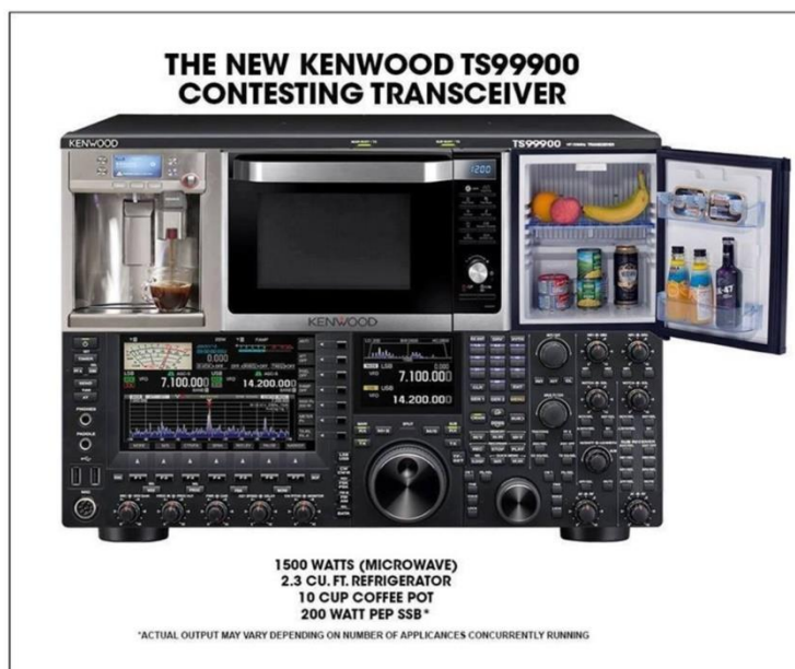
De TS9990 van Kenwood, speciaal gemaakt voor de deelname aan contesten (Uit de nieuwsbrief van PI4HAL)