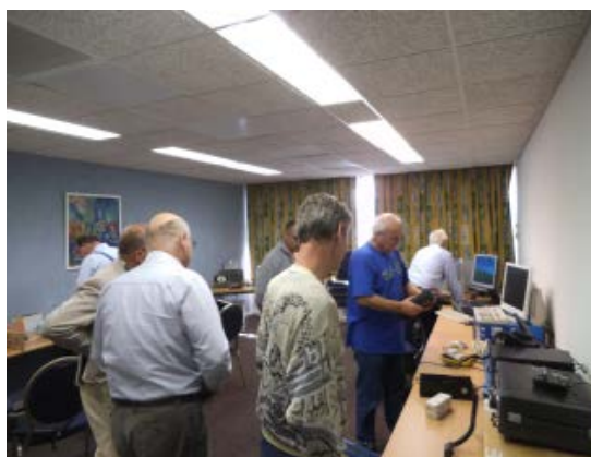
Druk in de opbouw