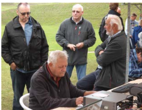
De nestor werd belangstellend gevolgd