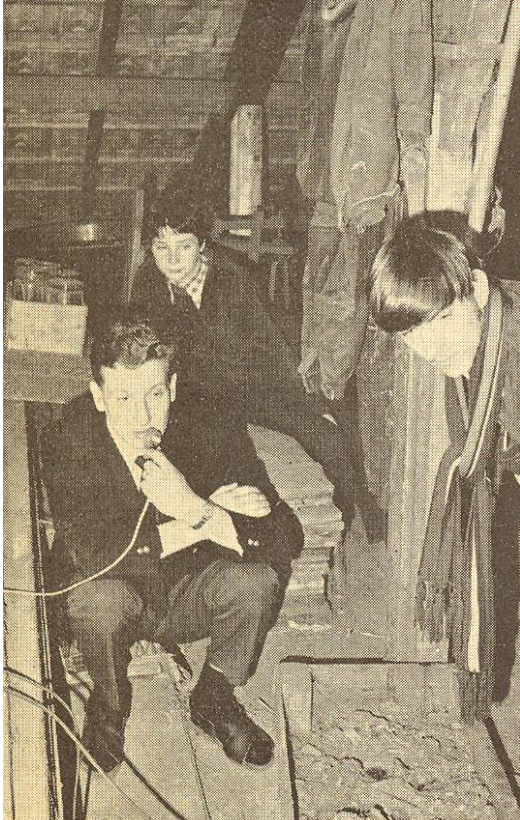
Nationale lustrum-paniekvossejacht van de afdeling Den Bosch werd groot succes. Op deze foto ziet u de zolder met de daarbij behorende attributen, waar vos nr. 2 zich op 8 juni verborgen had. Achter de microfoon PAoSVO.