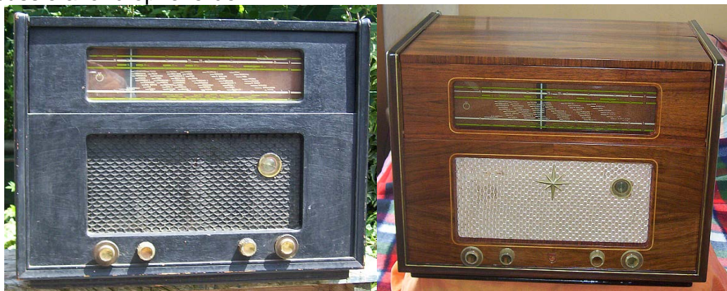
Zo aangeschaft, een Philips HX513a,

Al met al een geslaagde bijeenkomst, die buiten de verkoping een gezellige praat en discussie avond op leverde.