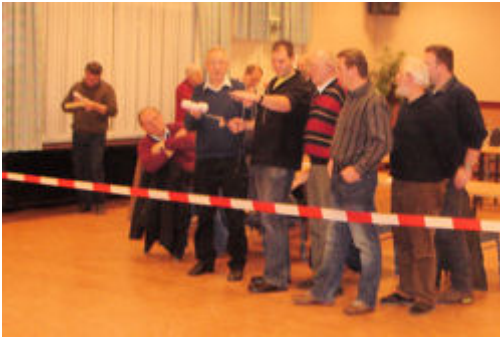
Aan die kant moet hij ongeveer zitten.