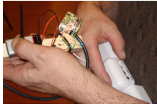
Echt handzaam waren de prototypes niet.