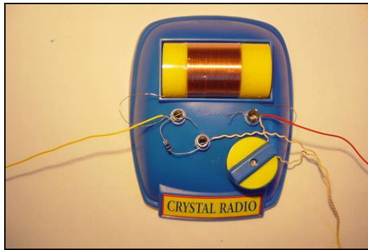
Een geassembleerde ontvanger

Hierbij moeten de leerlingen zelf een AM-kristalradio bouwen (zie foto hierboven). Met behulp van de meetzer van Theo en de oscilloscoop van de school kunnen we een AM-sigitaal laten zien en kunnen de leerlingen het sigitaal ook ontvangen op de eigen kristalradio.