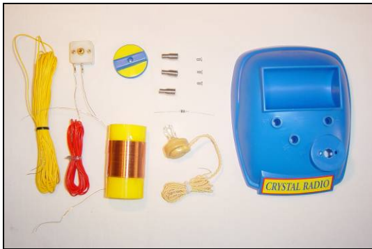
De losse onderdelen

De eerste workshop gaat over het bouwen van radio-ontvangers en zendtechniek.