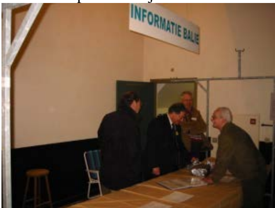
Info word graag verstrekt

Het weer heeft zeker hiertoe bijgedragen het was droog en zonnig maar koud (niet geschikt voor de tuin). Het aanbod was divers zoals we dat gewend zijn van deze markt, alle zaken die je verwacht op een dergelijke markt aan apparaten, meetapparatuur, gereedschappen, antennes, onderdelen, HF, SHF was aanwezig. Het prijsniveau is in de loop van de jaren wel gestegen, maar als je goed keek was er best nog wel een koopje te halen. Hoewel dit het tweede jaar was dat er een rookverbod gold, iets wat u ongetwijfeld bij meer gelegenheden in de toekomst zult aantreffen, was dit nog steeds niet voor iedereen duidelijk. Ondanks de opschriften en de omroeper die dit regelmatig liet horen, het zal wel gewenning zijn. Het merendeel van de standhouders die we spraken was tevreden met hun omzet. Wat ook opviel was dat het publiek altijd weer enthousiast is.