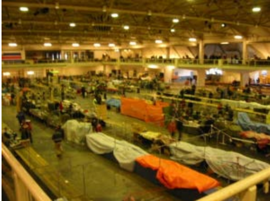
De opbouw, vroeg in de ochtend

Op zaterdag 18 maart jl. vond in Autotron te Rosmalen ('s-Hertogenbosch) de 31 e landelijke Radiovlooiemarkt plaats. In die een en dertig jaar is dit evenement uitgegroeid tot het grootste Radioamateur evenement van ons land. Er stonden 330 stands en alleen al het aantal mensen dat bij deze stands betrokken was bedroeg 825. Dat de markt een internationaal karakter heeft gekregen is het beste te zien aan de standhouders, deze kwamen uit de landen PA, ON, LX, D, F, G, HG, HB9, LY2, SP. Ook als je rondliep, hoorde je naast Nederlands vreemde talen, waarin Duits, Frans en Engels overheerste. Het bezoekersaantal is over de jaren redelijk stabiel, waardoor de organisatie dit jaar zelfs 2% meer bezoekers kon noteren als het afgelopen jaar, het aantal mensen in de zaal zit dan zo tegen de 5000. Dit is toch bijzonder want vele gelijksoortige markten in binnen en buitenland noteren een teruggang.