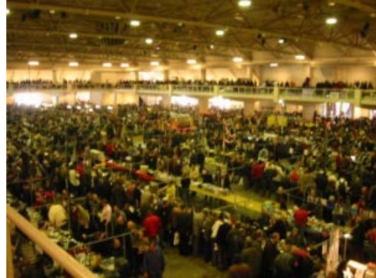
Het loopt al lekker vol

Het weer heeft zeker hiertoe bijgedragen het was droog en zonnig maar koud (niet geschikt voor de tuin). Het aanbod was divers zoals we dat gewend zijn van deze markt, alle zaken die je verwacht op een dergelijke markt aan apparaten, meetapparatuur, gereedschappen, antennes, onderdelen, HF, SHF was aanwezig. Het prijsniveau is in de loop van de jaren wel gestegen, maar als je goed keek was er best nog wel een koopje te halen. Hoewel dit het tweede jaar was dat er een rookverbod gold, iets wat u ongetwijfeld bij meer gelegenheden in de toekomst zult aantreffen, was dit nog steeds niet voor iedereen duidelijk. Ondanks de opschriften en de omroeper die dit regelmatig liet horen, het zal wel gewenning zijn. Het merendeel van de standhouders die we spraken was tevreden met hun omzet. Wat ook opviel was dat het publiek altijd weer enthousiast is.