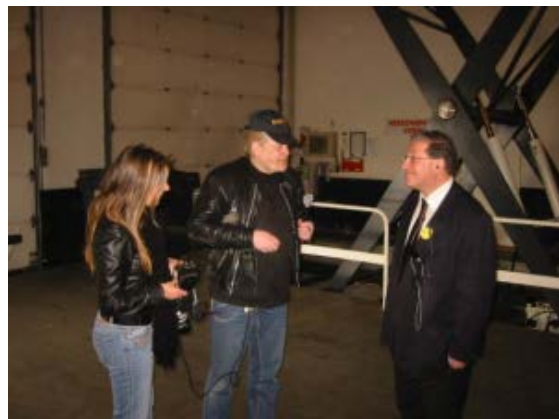
Ook de plaatselijke "pers" heeft belangstelling