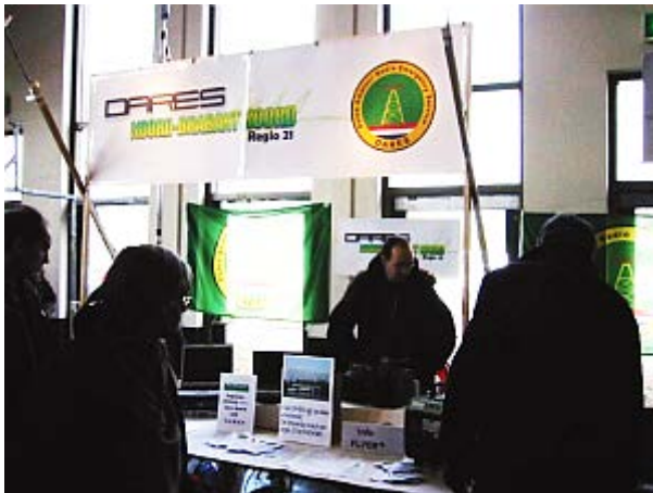
DARES ook op de vlooiemarkt aanwezig