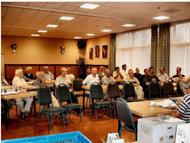
De zaal wacht met spanning op de veiling.