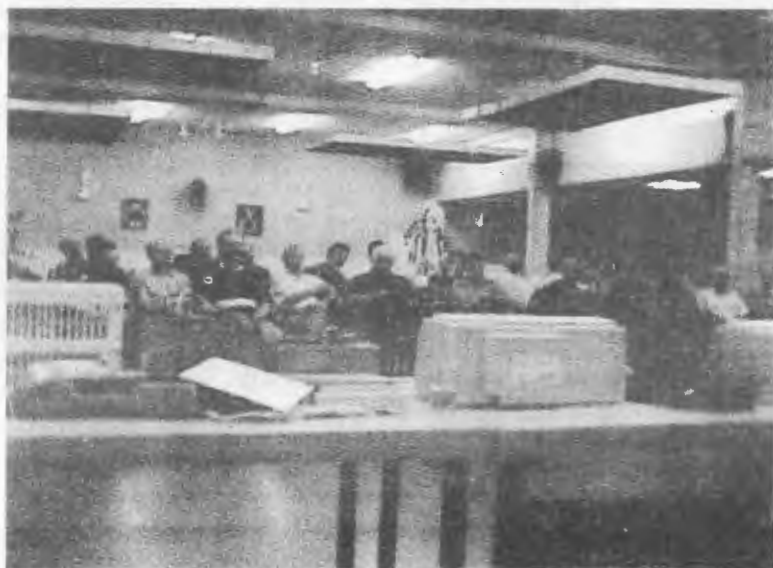
Gebrek aan belangstelling?