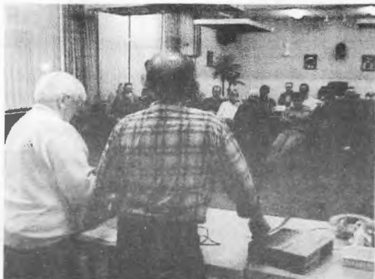
Roept u maar!