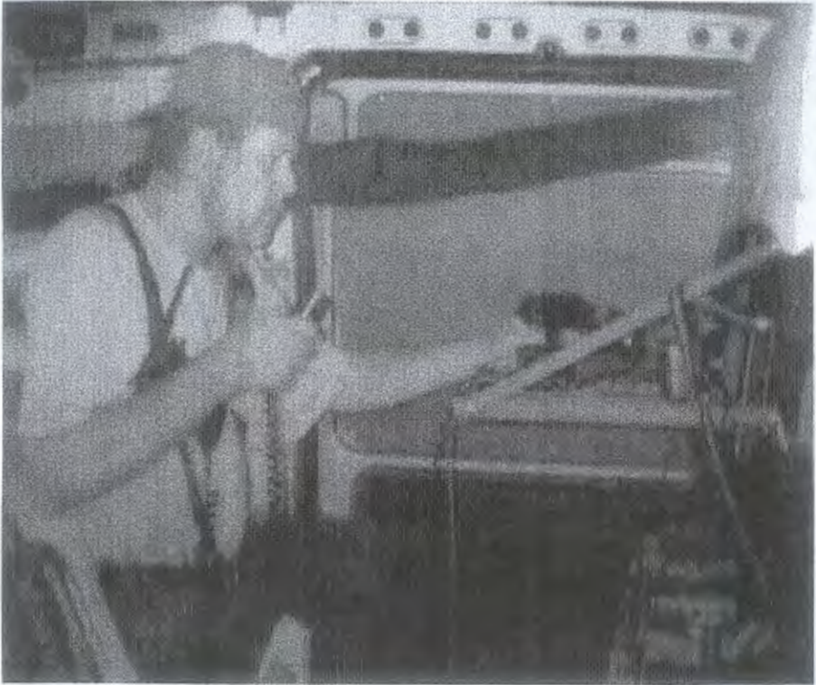
Hoe donker het was en hoe ver.

Koelbox en twee vakantiestoeltjes waren ook meegenomen. Bij Chris, PA5RWE, aangekomen om 6:20 stond ik even versteld van de spullen die allemaal in het busje moesten. Voordat we begonnen met inladen dronken we eerst even de "eerste levensbehoefte" oftewel koffie! De spullen pasten gelukkig allemaal redelijk makkelijk in de auto, hoewel de gehele laadvloer van het busje vol stond met spullen. Het enige dat nog gebeuren moest, was het aansluiten van de Teletron